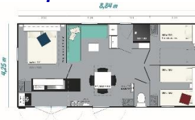
Super Cordélia 37m 2